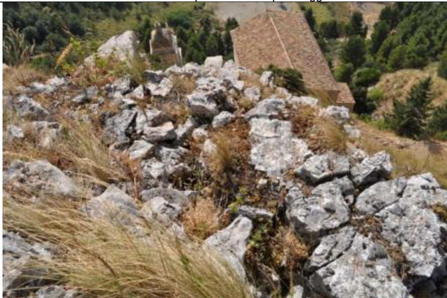
Foto n. 5 – Blocchi mobilitati di varie dimensioni sulla verticale del Santuario