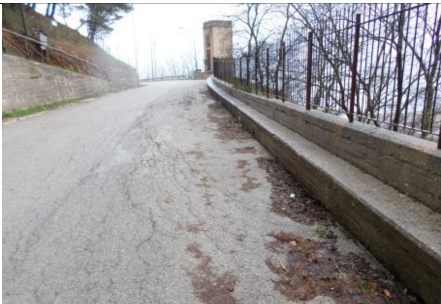
Foto n. 4 – Ribassamento della sede stradale in prossimità del parcheggio