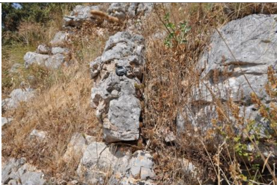
Foto n. 6 – Blocchi mobilitati di varie dimensioni sulla verticale del Santuario