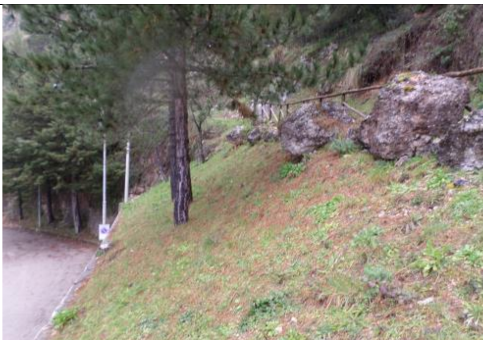
Foto n. 8 – Blocchi ciclopici con possibilità di rotolamento a valle, lungo la verticale del parcheggio