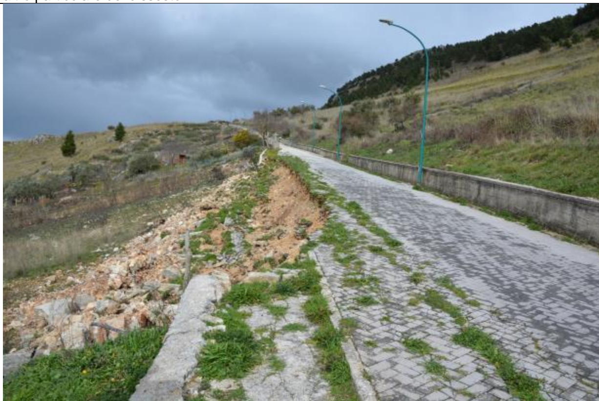
altro particolare del dissesto