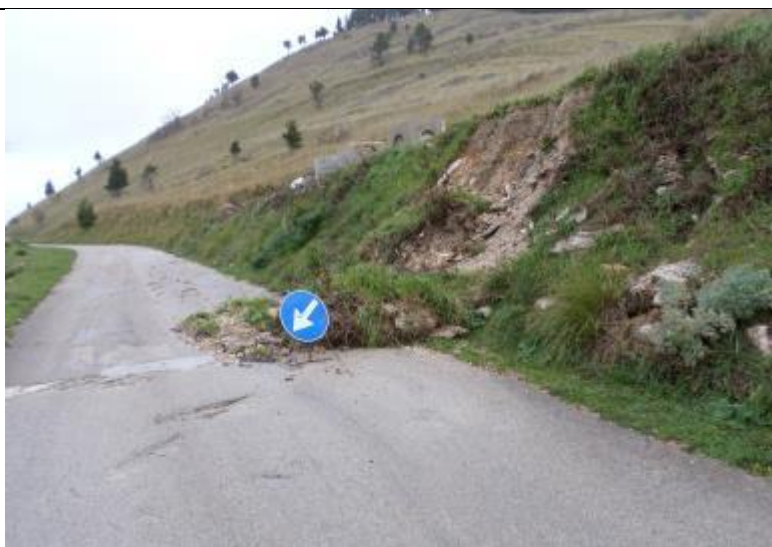
Foto n. 1 – smottamento scarpata di monte in prossimità dei magazzini LA RUSSA

Breve rassegna fotografica dei siti sensibili e delle criticità accertate: