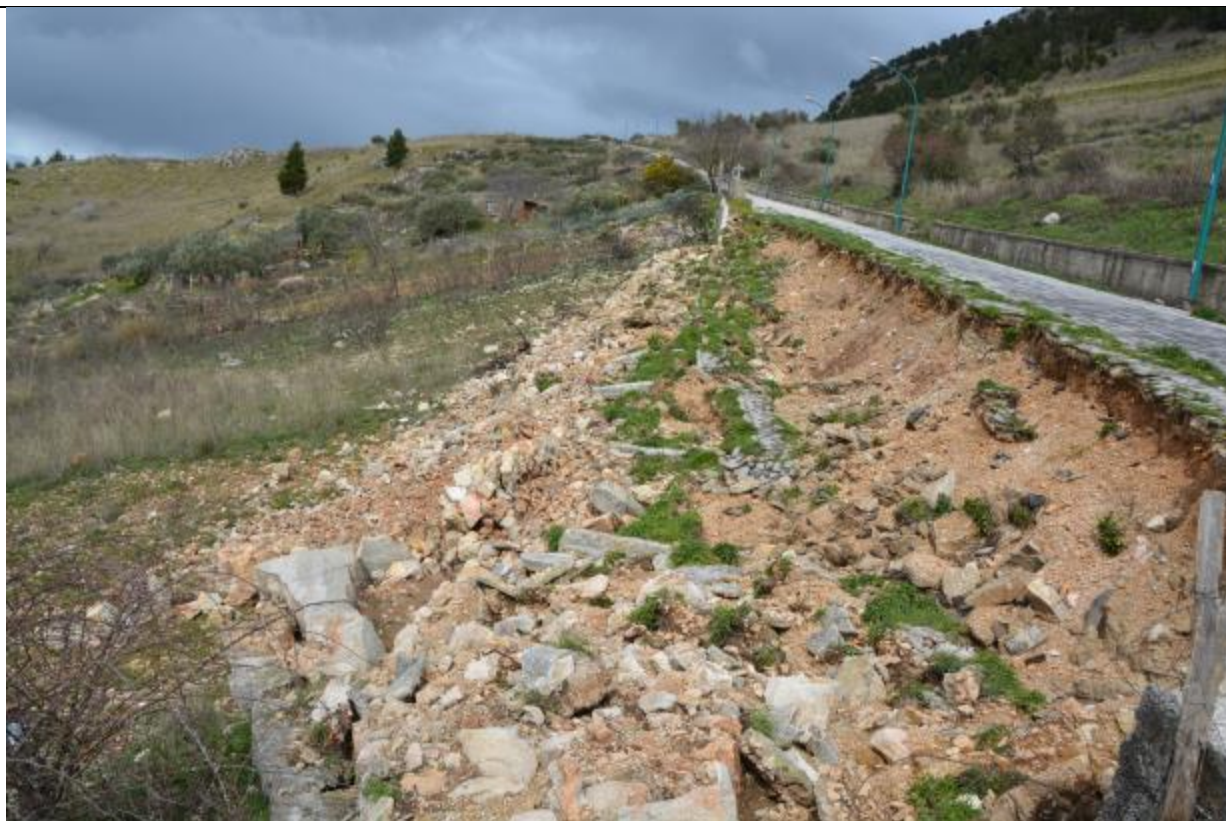
altro particolare del dissesto