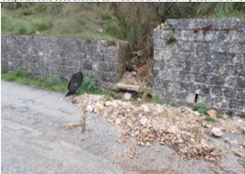
Foto n. 3 – detriti trasportati sulla sede stradale dall'incisione torrentizia in prossimità del tombino